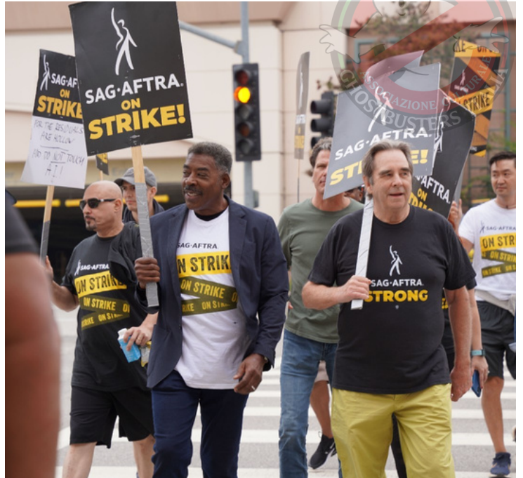
Ernie Hudson al picchetto di Los Angeles del 30 settembre

Il sindacato attori nasce nel 1933, con il nome di Screen Actors Guild. La veloce crescita del gruppo ha coinvolto gran parte della categoria, divisa in attori principali e attori secondari e di contorno (le comparse), fino al 2012, con la fusione del sindacato attori televisivi e radiofonici (la AFTRA, American Federation of Television and Radio Artists), nato nel 1937. Rispetto ad altre realtà, come quella italiana, la tessera sindacale è necessaria per lavorare in questi settori.